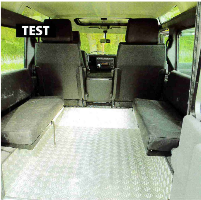
Nobel: Leder selbst auf den hinteren Querbänken, Aluminium-Boden, beheizbare Einzelsitze samt Cubby-Box in der zweiten Reihe.