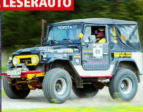
Urig: Toyota FJ 40 mit Extras