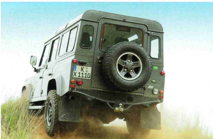
Schiebt an: Mit 400 Newtonmetern geht der Landy ans Werk.